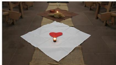
© H. HANKE Ein etwas anderer Kreuzweg zum Karfreitag